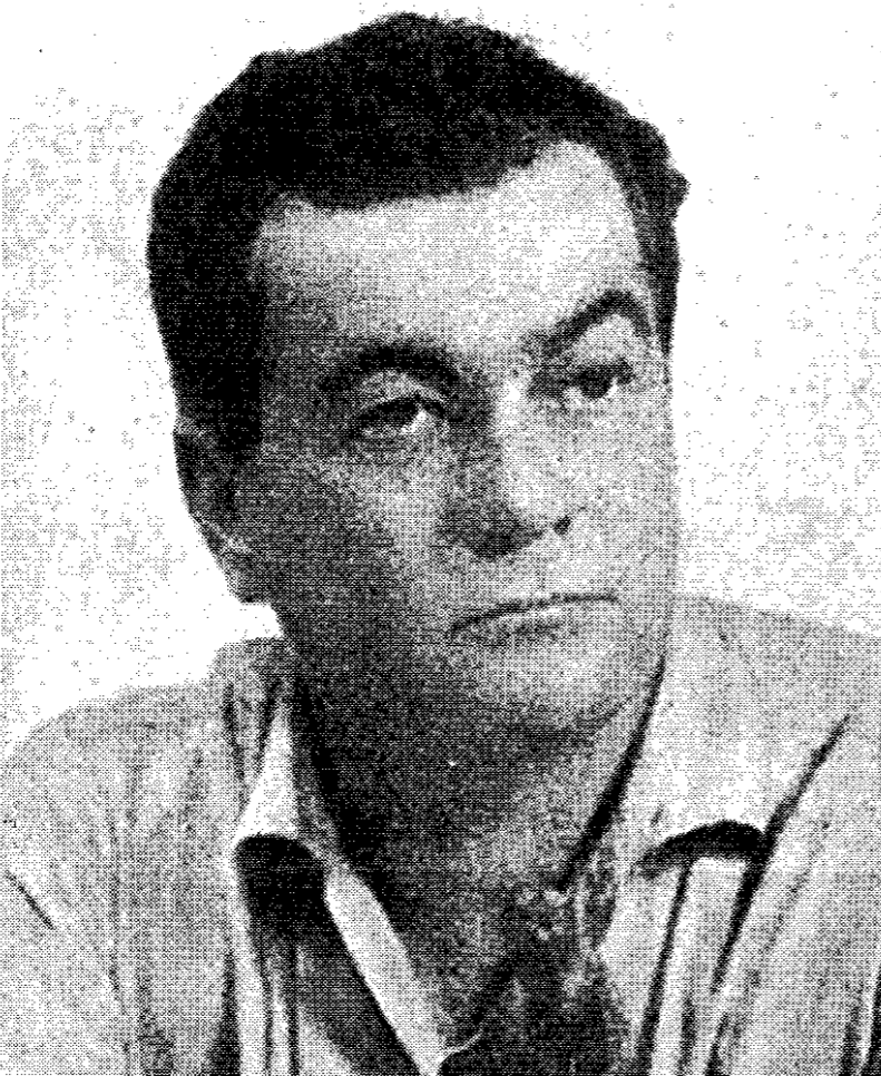
El escritor José Vasconcelos, mentor de la reforma educacional iniciada en los años veinte.

En 1974 cambió de estrategia, dedicándose a conseguir préstamos para las deudas del Estado. Luego llegó la inflación. La sucesión presidencial trajo al Ministro de Economía de Echeverría, José López Portillo, al mando para curar el malestar económico.